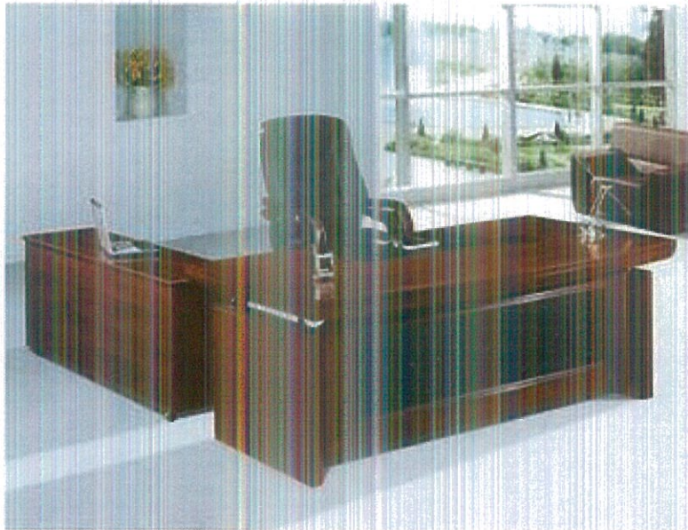
Meja Bo'ot P x L x T 180cm x 80cm x 72cm