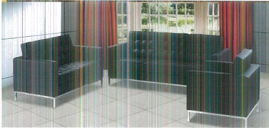
1 seater Sofa length 90cm